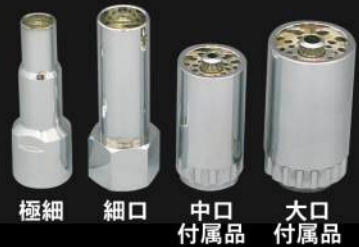
極細 細口 中口 大口 付属品 付属品

用途に合わせて使えるように、4種類の火口を用意。火口を揃える事により、細部の口付などからなまし作業までCAブローパイプで幅広い作業が可能です。